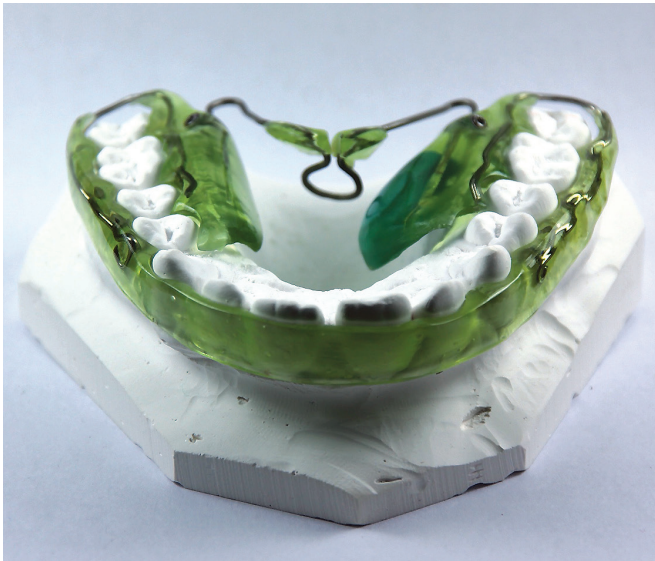
Figure 3 bis : Le Tongue Right Positioner (TRP)

Nous avons évalué l'efficacité de ce dispositif dans le traitement du SAOS en regroupant les données de patients traités par rééducation avec le TRP pour lesquels nous disposons de mesures avant et pendant le traitement de rééducation.