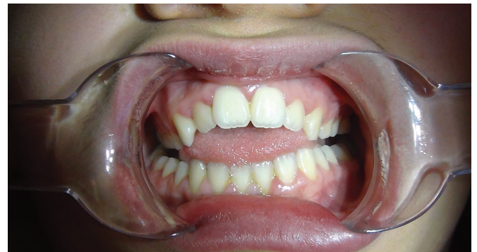
Figure 1: bénance antérieure et interposition linguale

Le problème des dysfonctions linguales n'est pas uniquement observé dans le cas des TROS. Ces conséquences sur les malocclusions sont aujourd'hui bien documentées [4]. Les traitements rééducatifs sont d'ailleurs utilisés par de nombreux orthodontistes à travers le monde depuis plusieurs décennies [5]. Les liens entre déglutitions atypiques, interpositions linguales et bénances antérieures sont par exemple assez bien connus (Figure 1). De nouveau, l'importance de la respiration nasale est un élément clé à la fois pour le traitement des TROS mais également des malocclusions dentaires. Un des derniers articles du regretté