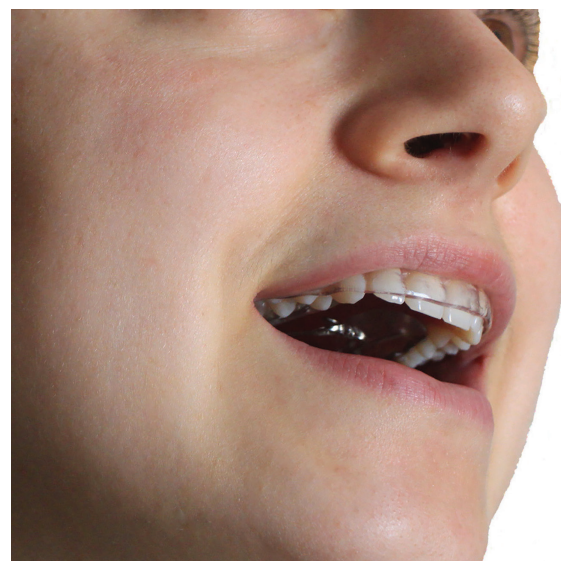
Figure 3 : le Tongue Right Positioner (TRP) en bouche

Ces mêmes travaux montrent également que la perméabilité nasale des patients avec béances antérieures traités par TRP, augmentent de 33% en quelques semaines. Ces résultats recourent de précédentes études qui montrent que le traitement TRP est associé à une augmentation de la perméabilité nasale, compatible avec une respiration appropriée au fonctionnement physiologique des voies aériennes supérieures. Cette augmentation est stable 11 mois après la dépose du TRP. De plus, des anciennes observations montrent que le port du TRP est associé avec une augmentation du diamètre antéropostérieur du pharynx [11]. L'ensemble de ces résultats suggère que le traitement TRP en agissant sur la fonction et la position linguale pourraient augmenter le diamètre du pharynx, restaurer une fonction nasale et pourrait être une alternative aux traitements actuels du SAOS.