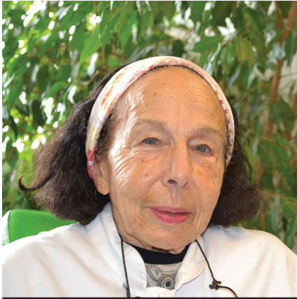
CLINIQUE DR CLAUDE MAUCLAIRE Orthodontiste Troyes 2